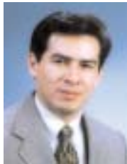
Por G. Jorge Medina

Colosenses 4:6 • 1 Pedro 3:15 • Judas 3 ♥ Los Pentecostales de Royalwood • Vol. 1 No. 1