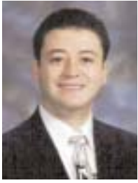
Por Samuel Mendizabal