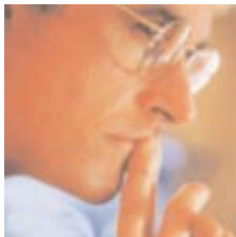
EL CRISTIANISMO ES RACIONAL

Las razones para hacer apologética que tenían los primitivos cristianos aplican en el siglo 21 tanto o más que en esos tiempos. El hombre científico moderno cree que la ciencia tiene la respuesta a todos los misterios de la vida, de tal manera que Dios ya no es necesario; lo tienen como una superstición (al estilo Santa Claus) que debe ser dejada atrás en este tiempo de "avance científico".