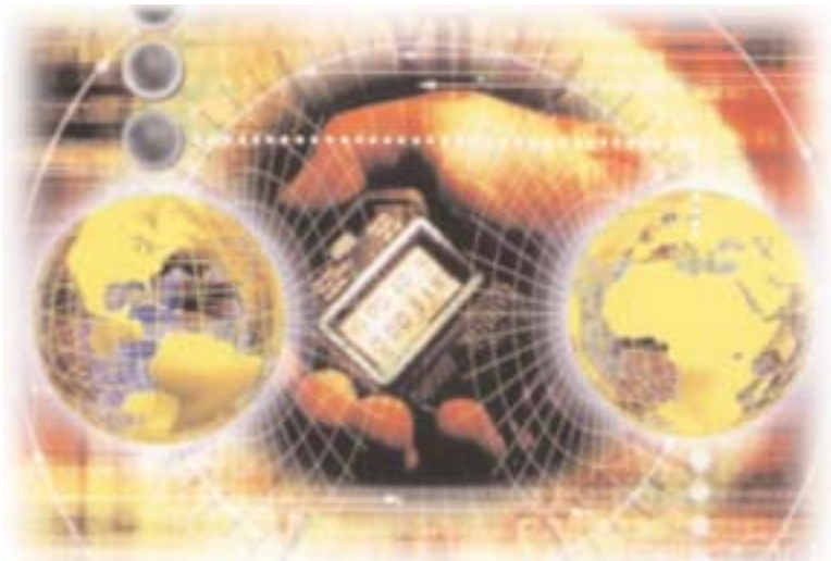
EL MUNDO SECULAR DEL SIGLO XXI DEMANDA QUE DEFENDAMOS LA FE

El Apóstol Pablo era un energético apologista de la fe, lo cual se ve en pasajes